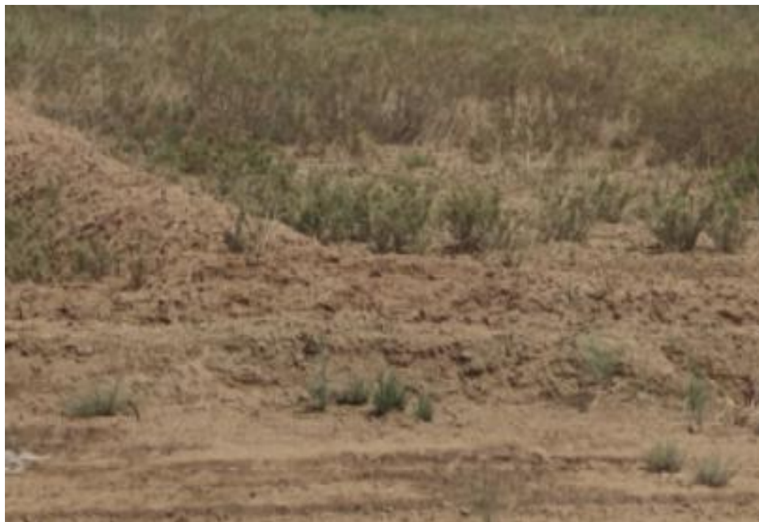
图3-2项目区林草地土壤剖面

其他土地（盐碱地）地貌类型以风沙地貌为主，受地貌、气候影响，土壤类型为风沙土，项目区范围内基本无植被。