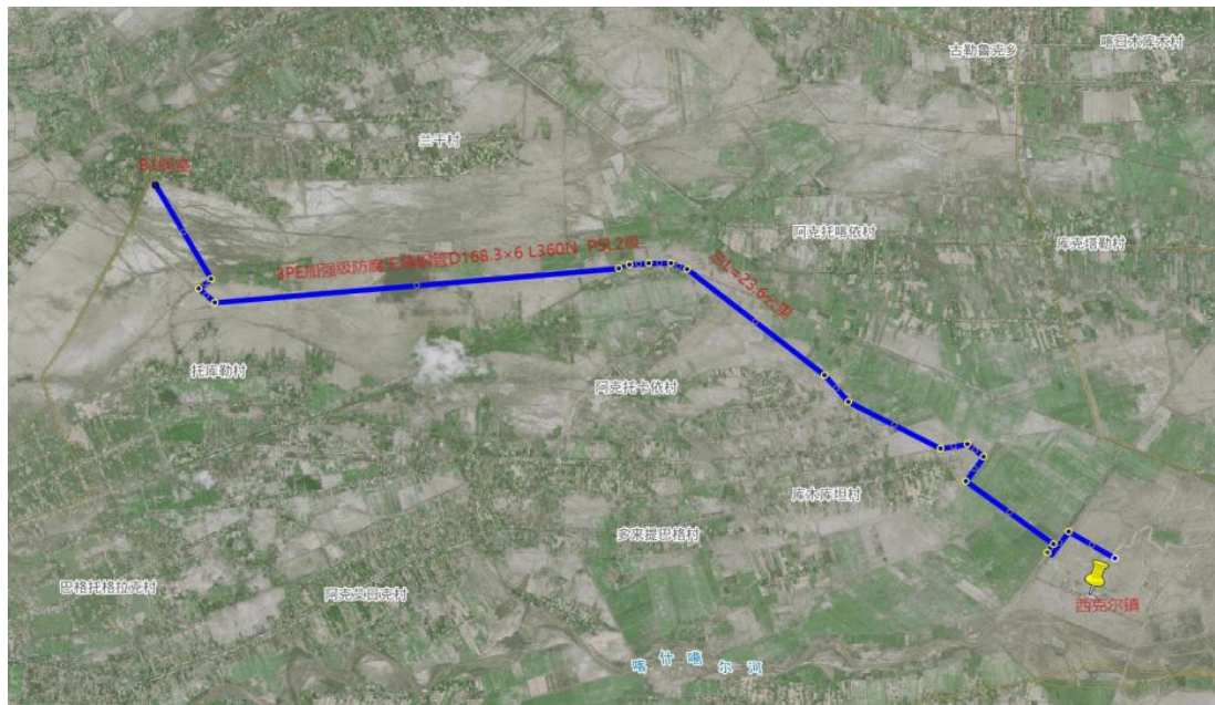
图3-1项目区地理位置示意图

西克尔库勒镇地处伽师县东北部，东与卧里托格拉克乡相接，南与和夏阿瓦提乡相连，西与克孜勒苏乡毗邻，北与古勒鲁克乡接壤，距伽师县城30千米。西克尔库勒镇新镇区属典型的北温带大陆性气候、其特点是冬季气候寒冷，春秋季干旱，夏季炎热。气温年变化大，日照长、降雨少，蒸发强烈、空气干燥。根据伽师县气象站1971~2016年观测资料，伽师县中部平原地区多年平均气温12.0℃，最热的7月份平均气温25.5℃，最冷的1月份平均气温-5.7℃，极端最高气温40.1℃，极端最低气温-25.5℃；最大冻土深度0.8m。新镇区所属伽师县降水量少，蒸发量大。多年年平均降雨量64.8mm月最大降雨量74.5mm，日最大降雨量56.9mm，降水形式多为暴雨。降水量随季节变化很大，主要集中在春夏季，约占全年降水量的80%，特别是8月份；秋冬季约占全年降水量的20%，11月份降水最少。多年平均蒸发量为2051.5mm，6、7月份蒸发最强。