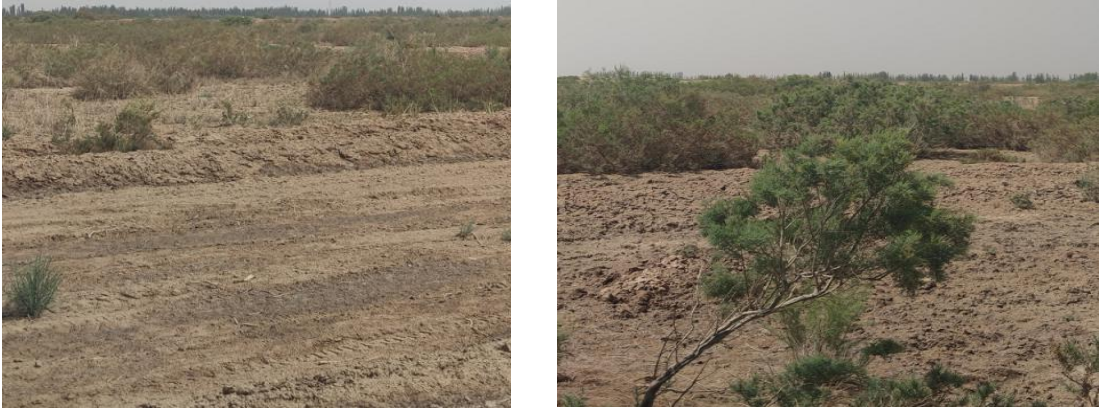
施工管道埋设区（盐碱地）地形地貌 施工堆土区（灌木林地）地形地貌

西克尔镇区位于喀什噶尔河流域中下游冲积平原，地形平坦开阔，高程一般为1182~1183米。镇区北部植被相对茂盛，中部及南部植被较稀疏，植被以红柳、芦苇为主。