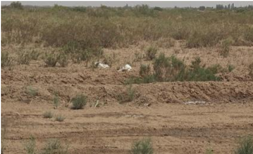
施工区中段地形地貌